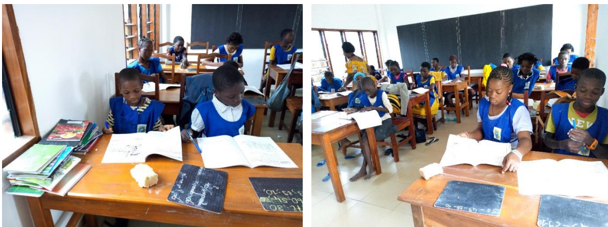
Niños/as del PCA en clase al inicio del año escolar 2020-2021

La demanda de matrícula en la escuela es fuerte y esto nos hace considerar la apertura del segundo año para el inicio del año escolar 2020-2021. El número total de niños de dos años es de 60 niños/as esperando abrir el tercer año (2021-2022) que llevará el número de niños/as a un máximo de 90 niños/as.