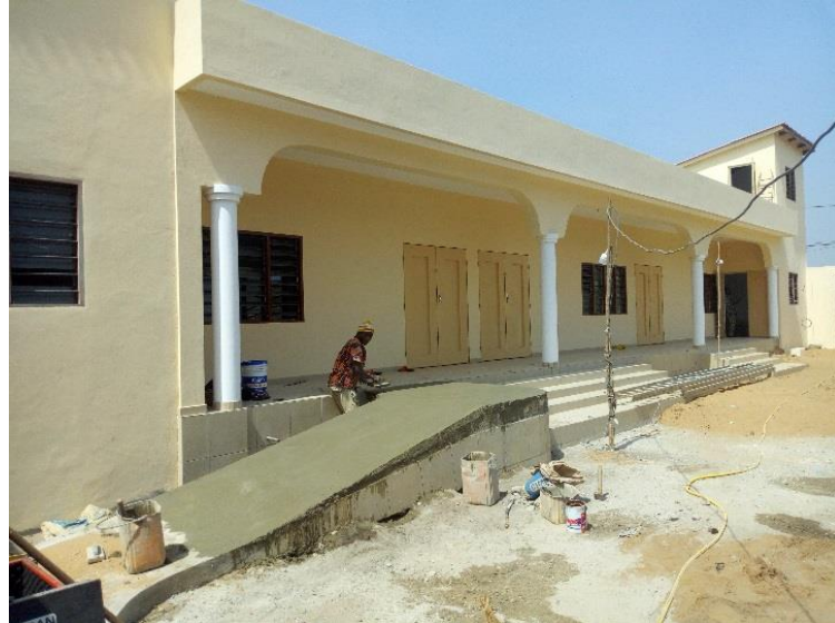
Etapa final del trabajo de construcción.