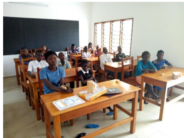
El primer día de clase en la escuela alternativa « LA PAZ » de Mensajeros de la Paz