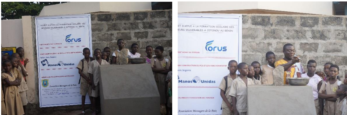
Primera piedra de la escuela alternativa PCA en presencia de los niños/as del centro de Alegría y del personal

El personal psicosocial también desarrolla la capacidad de los niños para tomar decisiones más adelante y actuar de manera positiva que los beneficiará a ellos y a quienes los rodean. También se trata de introducirlos en actividades de socialización que les permitan hacer frente a las demandas y desafíos de la vida diaria y ser adultos responsables más adelante.