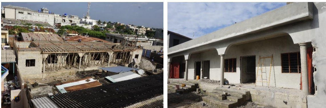
Evolución de la construcción de la escuela alternativa PCA

Financiado por los contrapartes Manos Unidas y Forus, este proyecto ya ha empezado y los niños asisten a las clases desde enero 2020; Los habitantes del barrio de Fidjrossè están contentos de la implementación de este proyecto que va a solucionar un problema crucial: poner en aprendizaje de manera precoz a los niños provocando así el fin de su formación escolar.